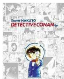
ロールカーテンの例