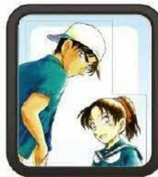
コナン君、蘭ちゃん、おなじみのキャラクターがいっぱい！