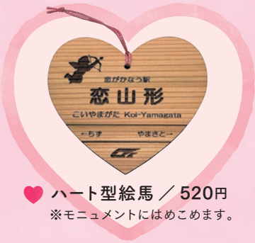
♥ ハート型絵馬 / 520円 ※ モニュメントにはめこめます。