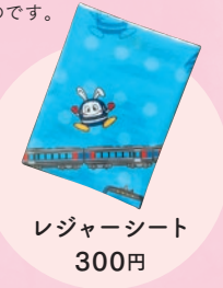
レジャーシート 300円