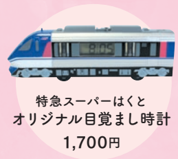
特急スーパーはくと オリジナル目覚まし時計 1,700円