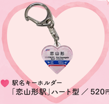
♥ 駅名キーホルダー 「恋山形駅」ハート型 / 520円