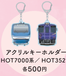
アクリルキーホルダー HOT7000系 / HOT3521 各500円