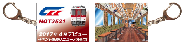
記念キーホルダー